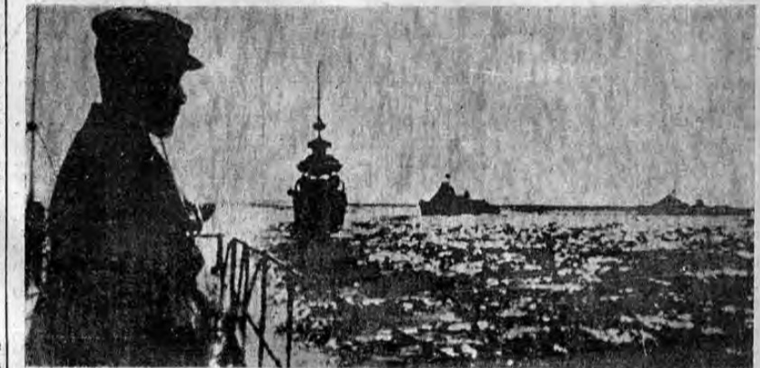
En esta foto, radiada de Moscú a Nueva York, se dice que la flota rusa evoluciona, preparada para la guerra marítima contra Alemania.

BERLIN, 28. UP. — Oficialmente se anunció que la resistencia sovi-